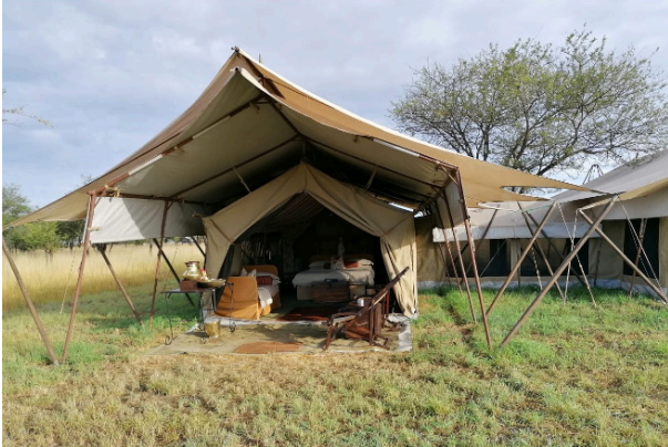
Nossa tenda de luxo no Under Canvas

tudo de fora. Minha curiosidade falou mais alta e fui atrás do gerente do camp para saber o milagre disso e a resposta foi simples. Café da manhã e jantar no Under Canvas Tudo vem de fora, 2 horas em avião e depois 45 minutos em carro duas vezes por semana. Um gerador a gasolina funciona durante o dia para carregar as baterias das geladeiras e de outras estruturas necessárias, mas a noite desligam para preservar o silêncio necessário para não atrapalhar os animais.