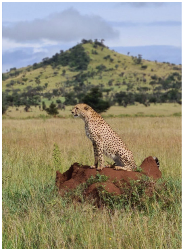
Cheetah a dois metros do nosso jeep

Almoçamos com uma vista linda do bar que fica no rooftop das áreas comuns do Faru Faru e a tarde fizemos um safari mais que especial, pois em meio a procura de animais pela savanah nos deparamos com uma cheta lindíssima passeando e procurando seu almoço - ficamos ao redor dela por umas duas horas para buscar a melhor foto e ficou perfeito.