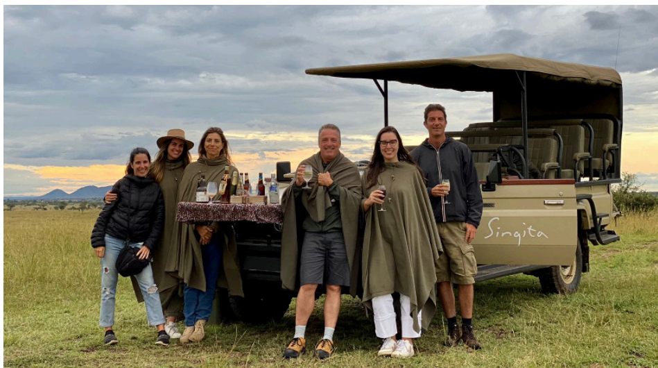
Nossa tripulação sempre a postos

Tanzânia, Safari e os lodges AndBeyond e Singita ficaram marcados para sempre em minha vida. Voltarei sempre que puder e divulgarei a todos que o paraíso existe e não necessariamente precisa ter palmeiras e uma praia para tomarmos uma marguerita.