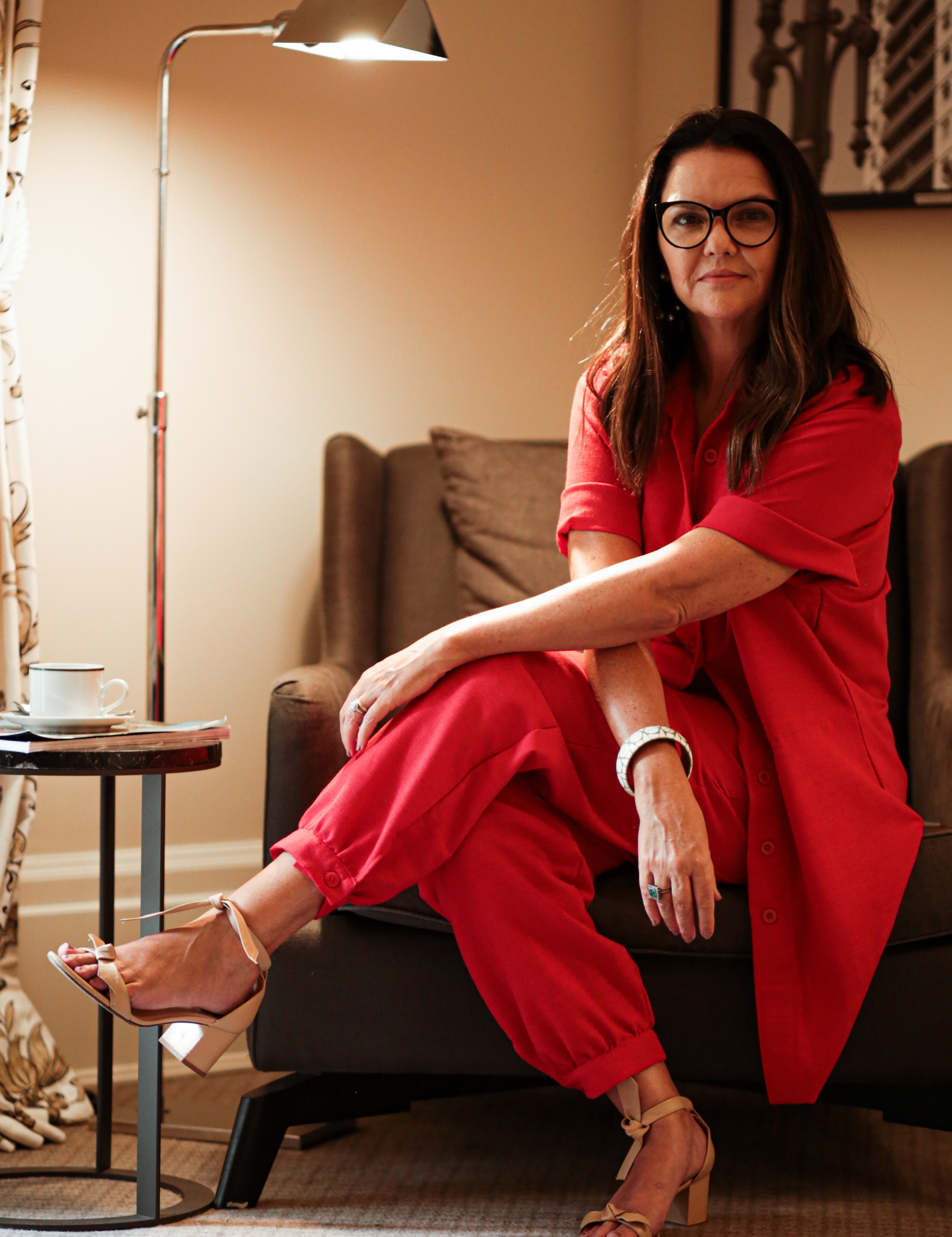
Look: Renata Galeano | Sapato: Alexandre Birman | Anel: Leo Flórense